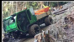
Holz Rungen Forst - Einsatz