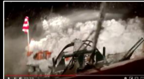
Anbaugerät: Schneepflug BOSCHUNG