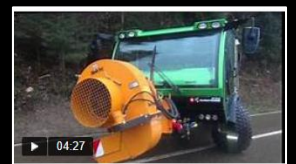
Anbaugerät: Front Laubbläser