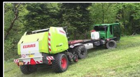
Rundballen – Presse CLAAS – gezogen