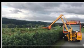
Anbaugerät: Ausleger - Mulcher, PA48E