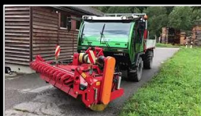
Anbaugerät: Frontkehrbürste DÜCKER