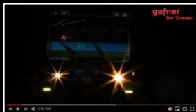
Gafner Streuer - Vielfalt