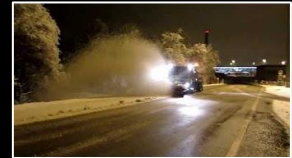
Anbaugerät: Schneebesen 2800 mm