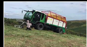
Mäheinsätze EUROTRANS Frontmäherwerke Vielfalt