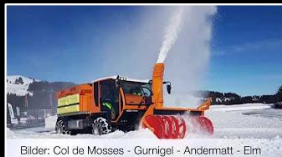
Anbaugerät: Schneefräse Kahlbacher KFS 850/2500