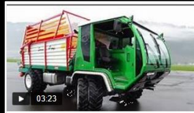
SCHILTRAC SWISSTRANS présentation (f)