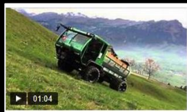
GAFNER 7 m³ Miststreuer