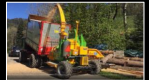
Holzacker ISELI HM8-400