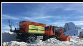
Bedienung BOSCHUNG Salzstreuer IMS E 3.0 m 3