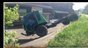
SCHILTRAC Steilrampe/ Bodenfreiheit