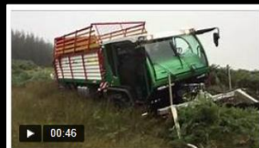
Frontmäherwerk BUSATIS BIDUX – 260 cm