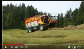
SCHILTRAC CVT auf nassem Untergrund