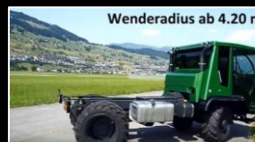
Schiltrac - Lenkarten