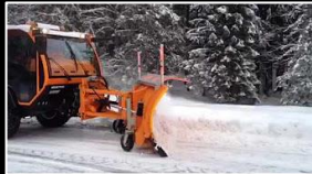
Anbaugerät: Schneepflug ZAUGG

EUROTRANS / SWISSTRANS - MULTIFUNKTIONAL – AUF-/ANBAUGERÄTE Übersicht