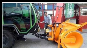
3-Punkt Fronthydraulik Geräte ankuppeln