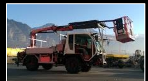
Anbaugeräte; Seilwinde, 12mt Kranaufbau