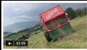
LÜÖND 33m³ Hecklader