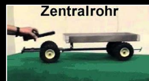
Schiltrac Lernvideo Hebelgesetz

Wir präsentieren eine Auswahl von verschiedenen Videos als Demogrundlage für unsere Kunden. In den Videos sehen Sie mehr von der spezifischen An- und Aufbauvielfalt und damit verbundenen Einsatzmöglichkeiten, Informationen über die Einfachheit und Erleichterung der Bedienung, sowie grundsätzlichen Produktinformationen. Die Videos stellen eine grosse Auswahl von Praxisbeispielen zur Verfügung, welche zeigen, dass SCHILTRAC leise und kraftvoll für jedermann in Landwirtschaft und Kommunaleinsatz, eine lohnenswerte Investitionen in die Zukunft ist. «Einmal fahren, anstelle Zweimal.»