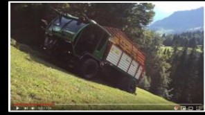
LÜÖND 33m³ Hecklader