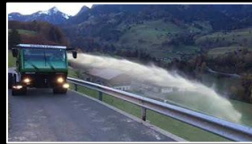
KURATLI Güllen -Fass