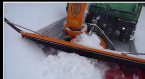
Anbaugerät: Schneefräse WESTA