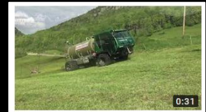
SCHWEIZER Güllen- Fass bis 6500 l