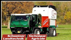
Rundballen -Presse LÜÖND Profipress