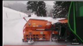
Anbaugerät: Schneepflug WINTEC VARIO