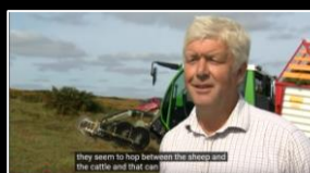
BBC Report UK Mähen - Laden «all-in-one»