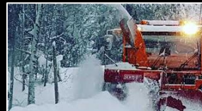
Anbaugerät: Schmidt SF3Z.1 Rand Schneefräse