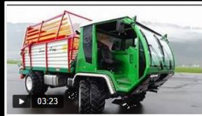
SCHILTRAC SWISSTRANS Vorstellung (d)